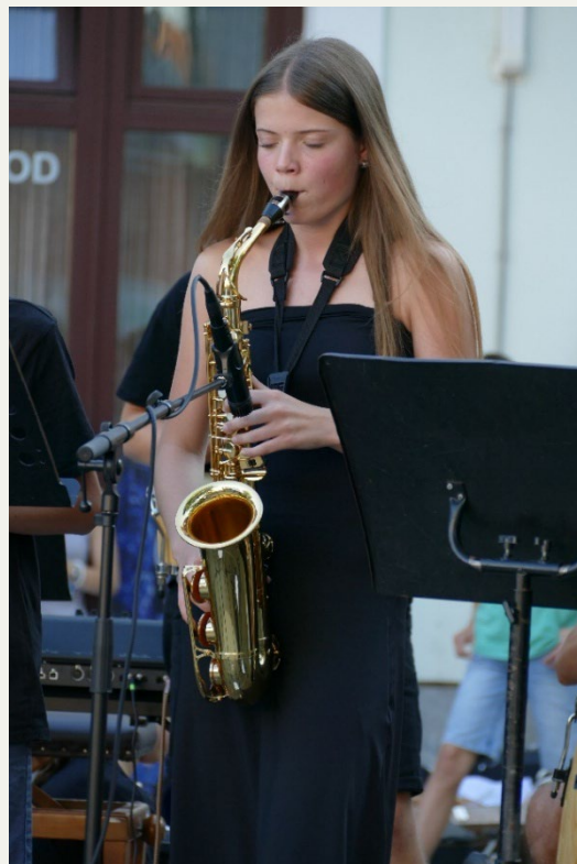
Otroški Jazz Campus 2025, Mestna ploščad