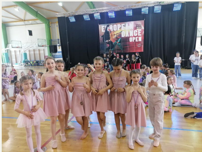
Baletni oddelek, Crikvenica