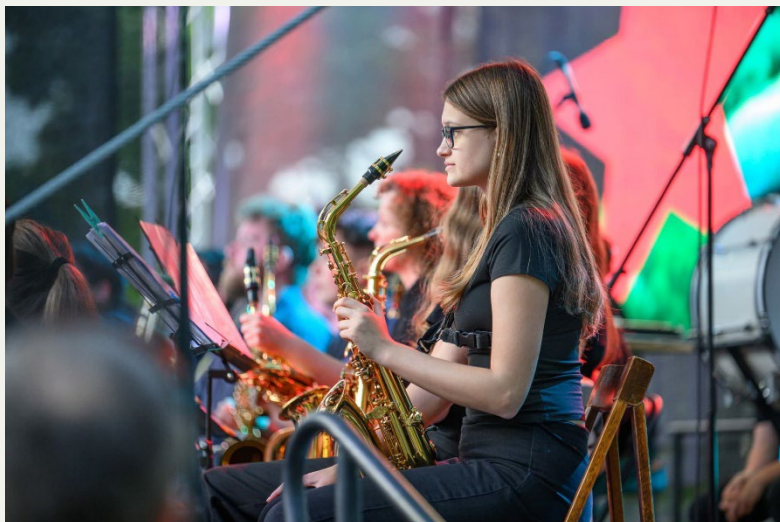
Simfonični orkester ob dnevu Državnosti, Kočevje