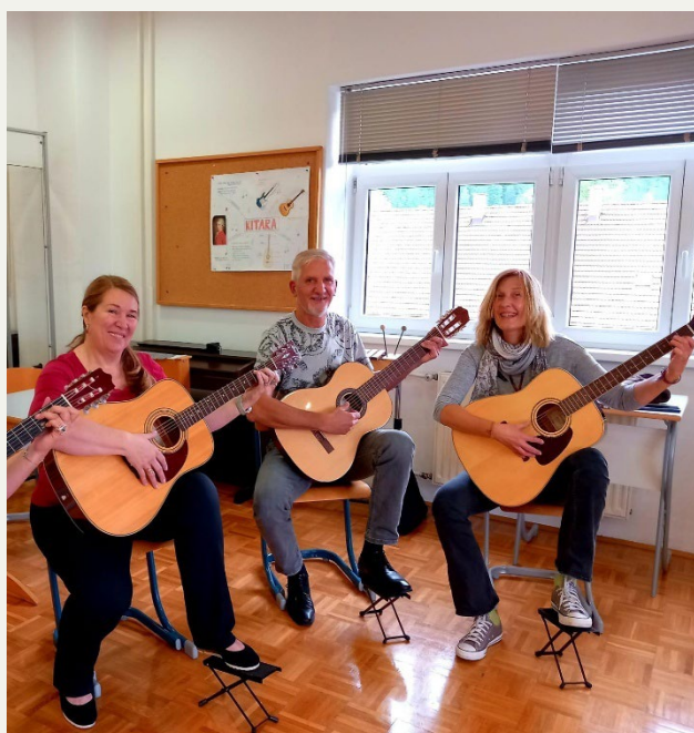
Kitaristi na ljubiteljskem programu

LJUBITELJSKI PROGRAM – se izvaja in financira po Pravilniku o ljubiteljskem programu. V šolskem letu 2023/2024 je na ljubiteljski program vpisanih 9 učencev, se pa to število pričakovano poveča med šolskim letom.