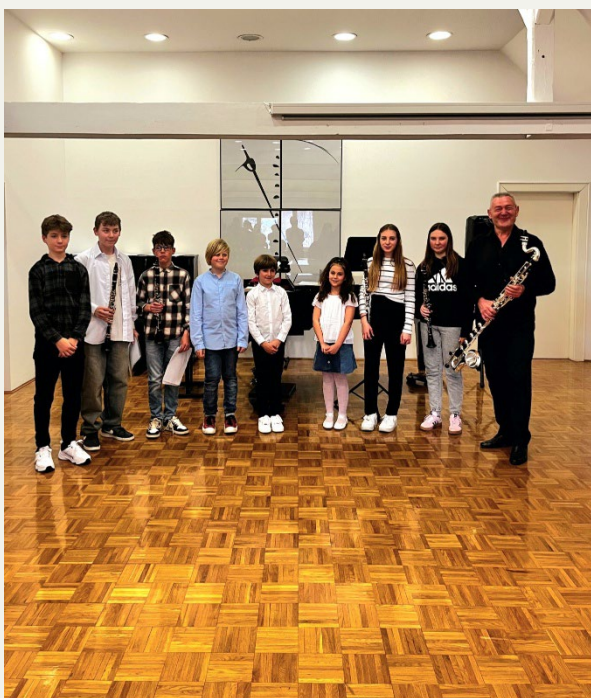
Razredni nastop klarinetistov