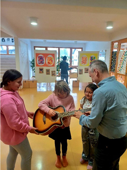
Predstavitve instrumentov, OŠ Stara Cerkev

Pouk se odvija na matični šoli in na dislociranem oddelku v OŠ Stara Cerkev.