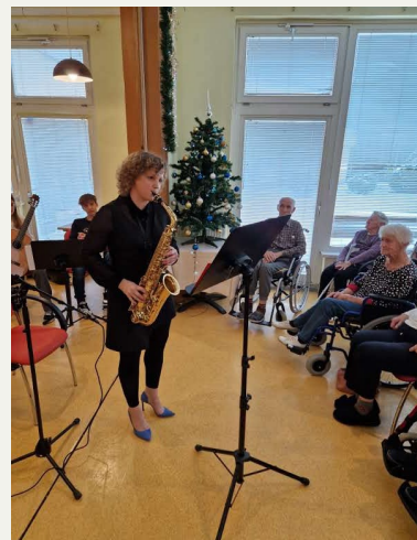
Učenci GŠ Kočevje, Upokojenski dom Kočevje