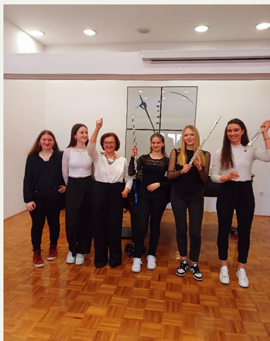
Razredni nastop flavtistk