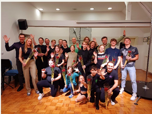
Koncert družin, GŠ Kočevje