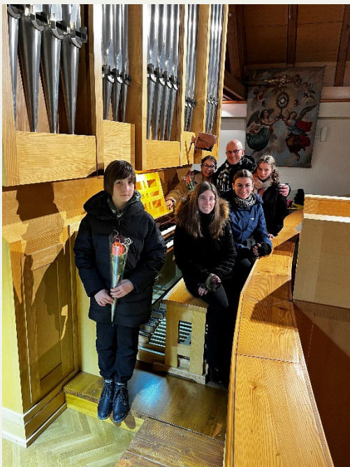
Učenci orgel, Kočevska Reka