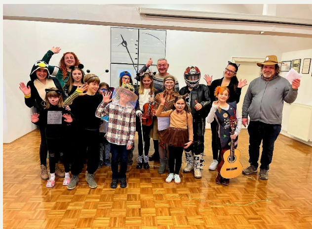
Nastop v pustnih maskah, GŠ Kočevje