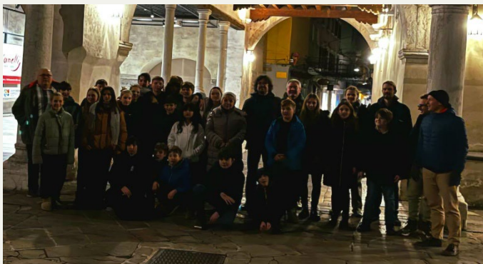
Glasbena šola Kočevje na gostovanju v Kopru