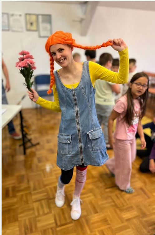
Glasbena predstava Pika Nogavička, GŠ Kočevje