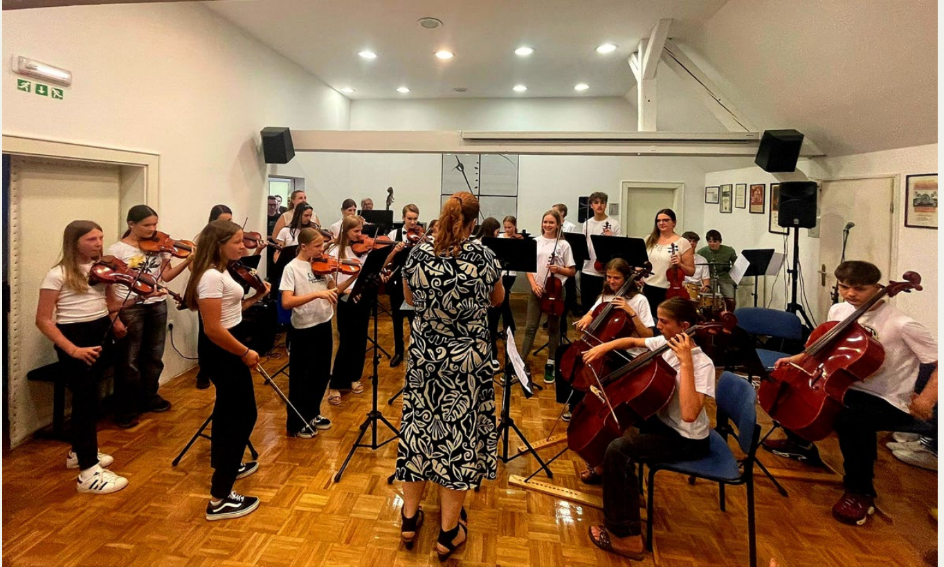
Godalni orkester na zaključnem nastopu, dvorana GŠ