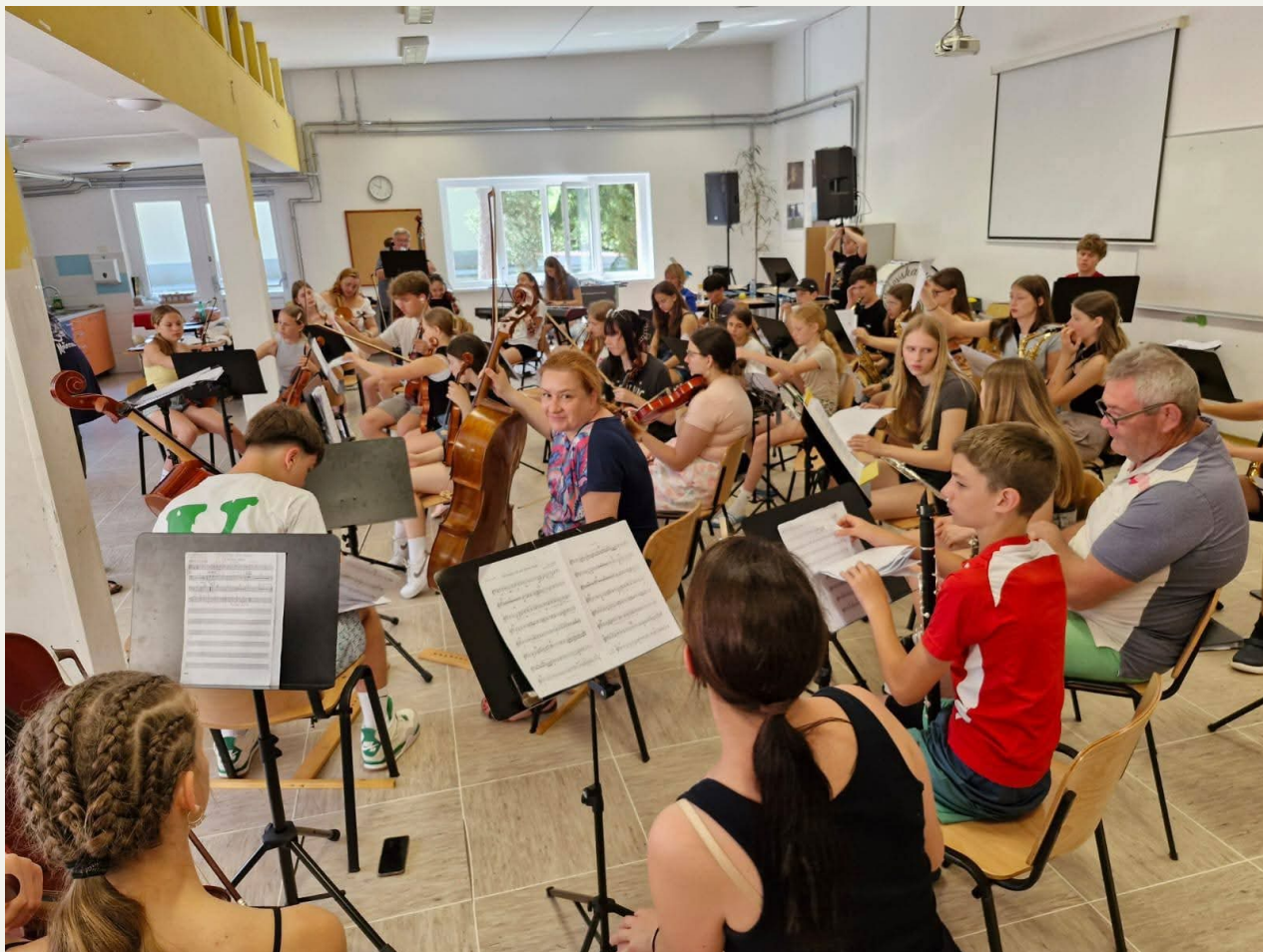
Simfonični orkester, Intenzivne vaje na Debelem rtiču